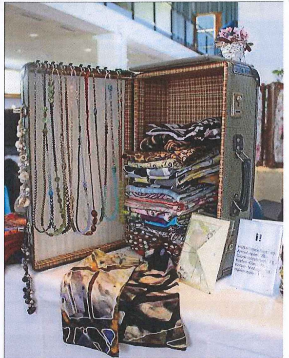
«Hüftschmeichler», ein schlauchartiges Tuch, das um die Hüften getragen wird, und Ketten wurden in diesem antiken Köfferchen verkauft.