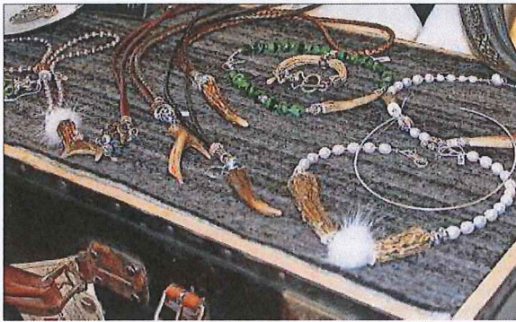
Urchig, aber dennoch elegant: Schmuckstücke aus Rehgeweih.