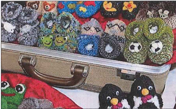
Das perfekte Babygeschenk: süsse handgestrickte Finkchen.