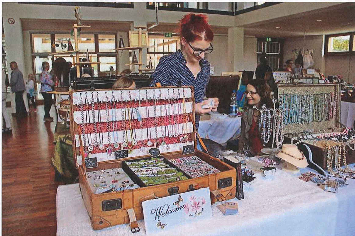
Zu erschwinglichen Preisen: Aus diesem Koffer gab es handgefertigte Schmuckstücke mit fröhlichen Motiven zu erstehen.